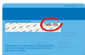
Rückseite einer Kreditkarte mit Kartenprüfnummer

Darüber hinaus unterstützt Sie ConCardis bei der PCI-Zertifizierung, die Sie vor Angriffen von Hackern schützt.